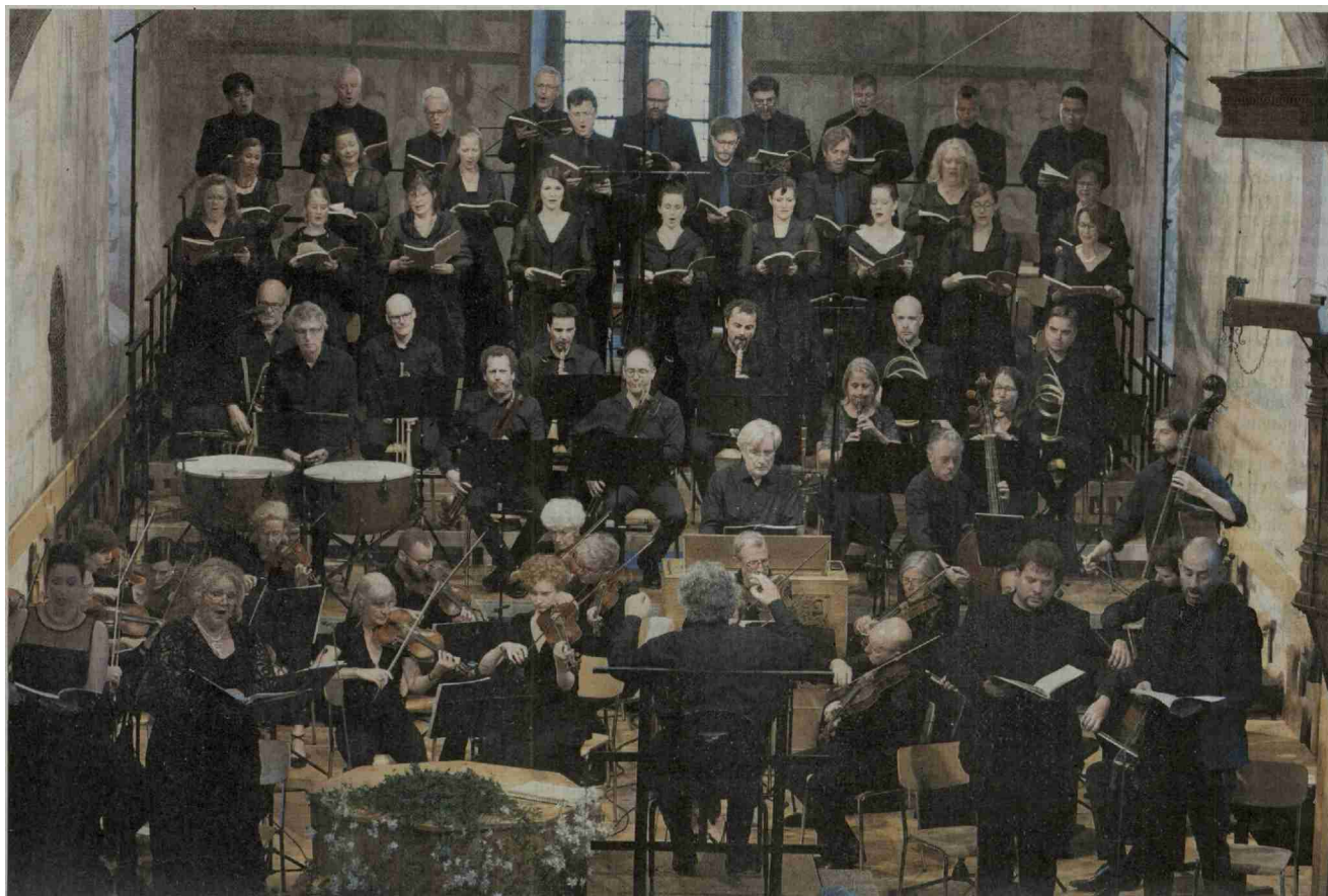
Concert d'ouverture dirigé par René Jacobs, au Gstaad Menuhin Festival (Suisse), le 15 juillet. MARIE-AUDE ROUX

La manifestation helvétique créée en 1957 par le grand violoniste renoue avec le succès et le public