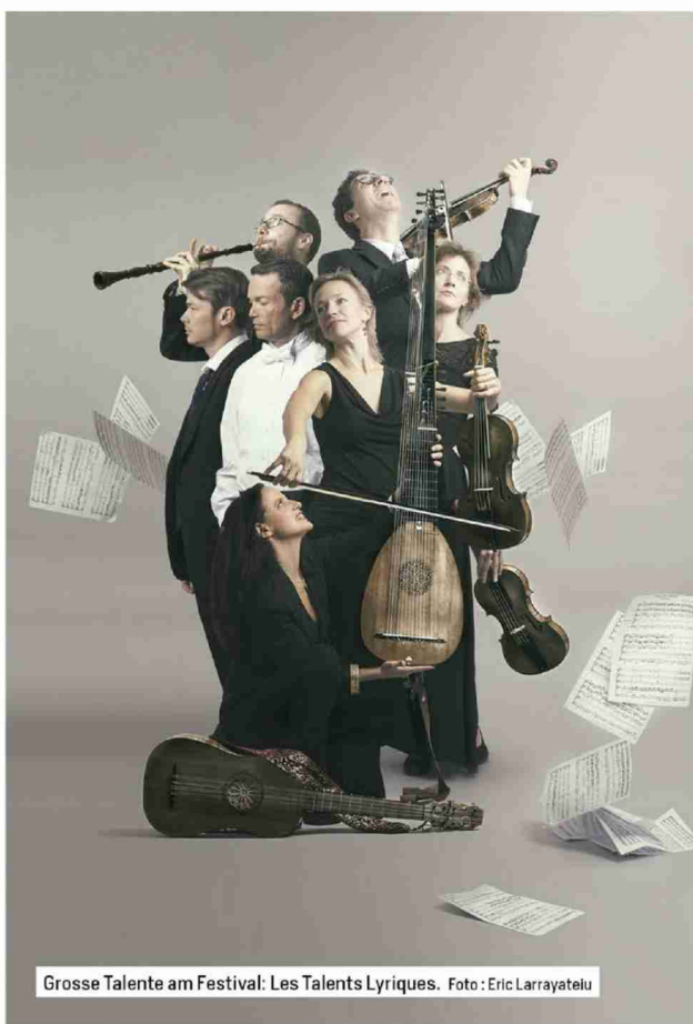
Grosse Talente am Festival: Les Talents Lyriques.

Auftrag: 1086199 Referenz: 84984160 Themen-Nr.: 831.009 Ausschnitt Seite: 7/9