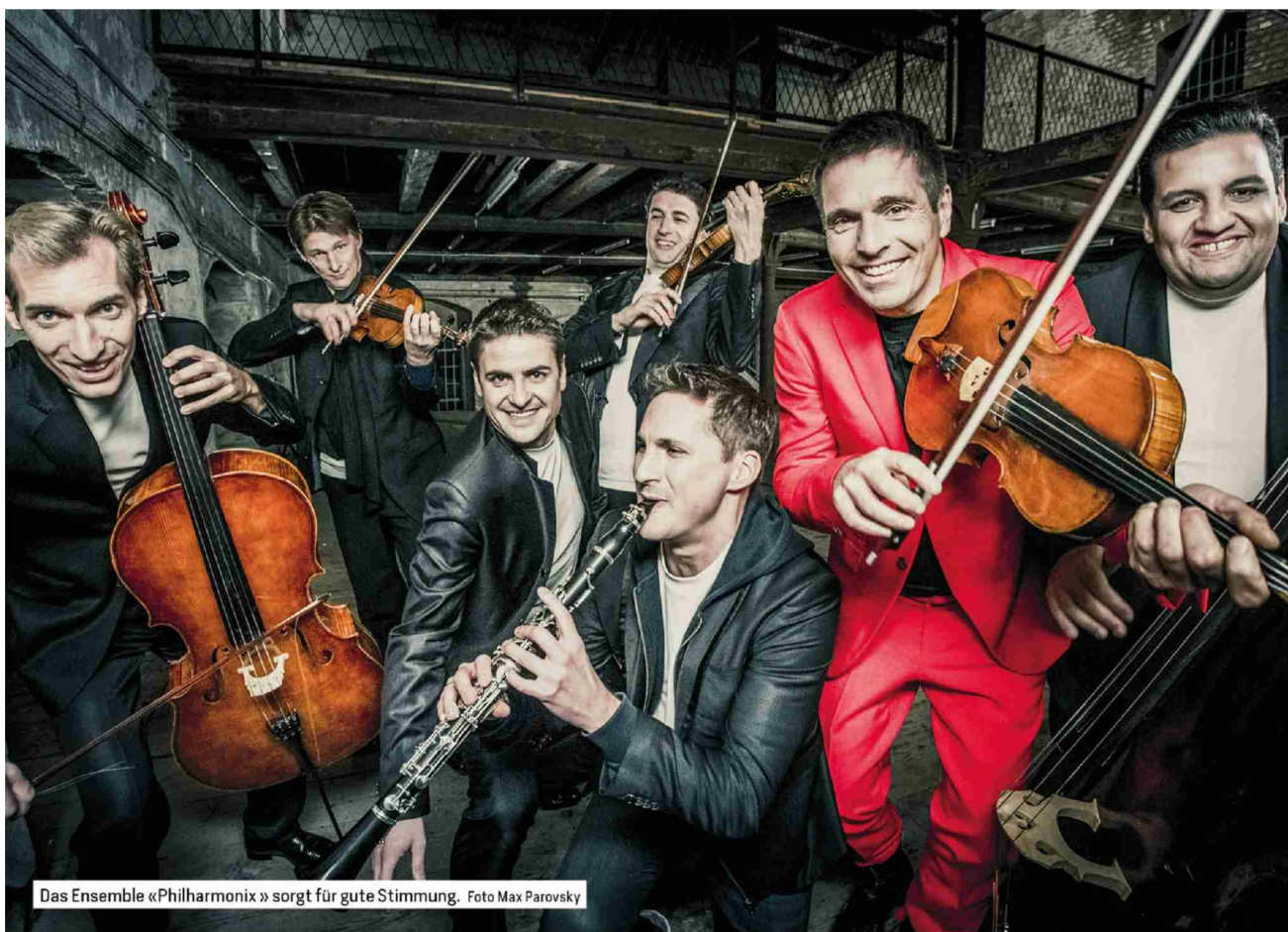
Das Ensemble «Philharmonix» sorgt für gute Stimmung.