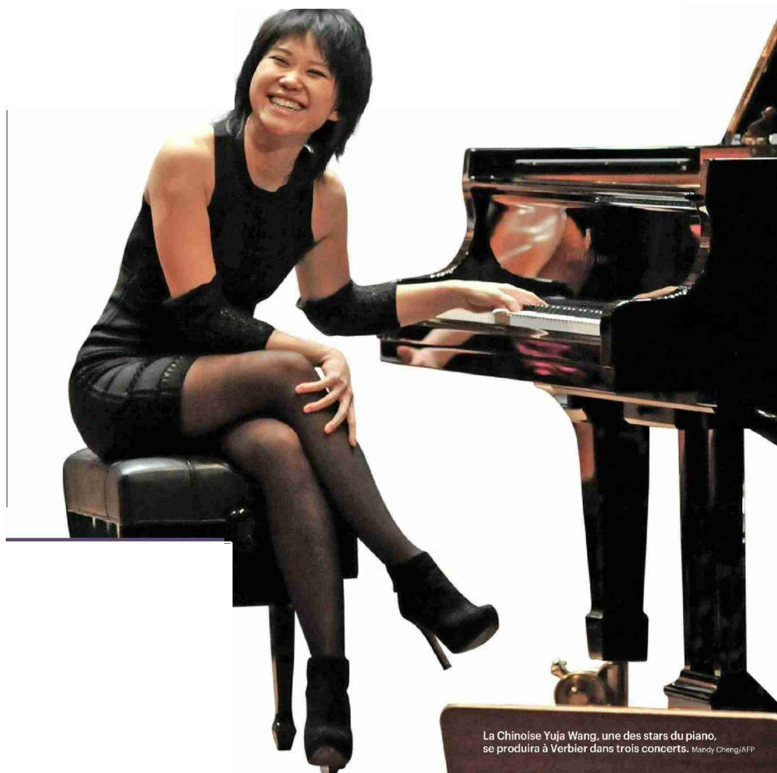
La Chinoise Yuja Wang, une des stars du piano, se produira à Verbier dans trois concerts.

Il y a trois pianistes aujourd'hui disparus vers lesquels je reviens toujours: Clara Haskil, Dinu Lipatti et Emil Gilels. J'écoute tout ce qu'ils ont enregistré. Pendant des années, j'ai cherché un document audiovisuel sur Haskil ou Lipatti. De Clara Haskil, il existe 20 secondes avec Charlie Chaplin, dans son jardin à Vevey. De Dinu Lipatti, mort à 33 ans d'un Hodgkin, à Genève, il ne reste hélas rien. Pas même un film de famille.